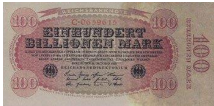
Billete de 100 billones de marcos

Ante ésta situación, Alemania llamó a la resistencia pacífica (era imposible tomar de nuevo una posición beligerante) y se produjo una huelga prolongada. La decisión final del gobierno fue pagar las deudas a través de la emisión sin control de papel-moneda, provocando un fenómeno hiperinflacionista inverosímil. Como curiosidad, la producción de billetes llegó a ser tan desproporcionada que más de doscientas empresas papeleras producían sin descanso billetes, imprimiéndose, por cuestiones de rapidez y de coste, solo por una cara.